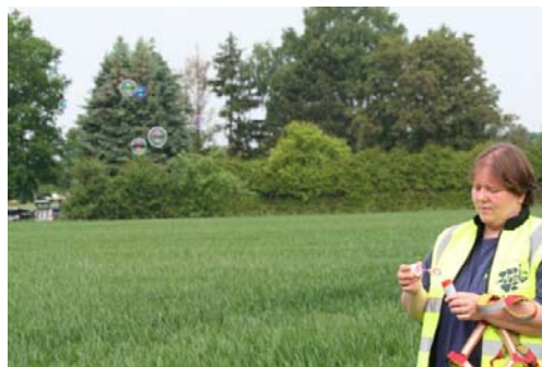
Seifenblasen....wie weit werden sie wohl fliegen??

Die theoretischen Grundlagen wurden jeweils beim Frühstück erklärt und erste Fragen wurden beantwortet.